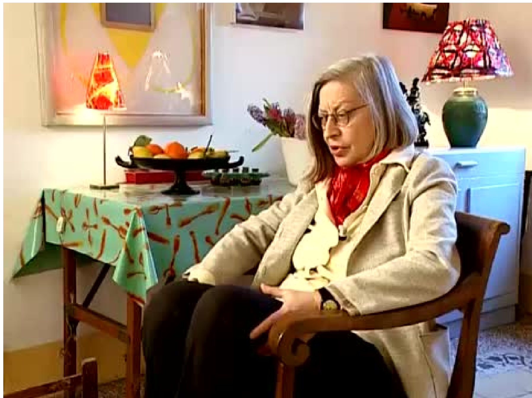
PATRIZIA CAVALLI SU ELSA MORANTE